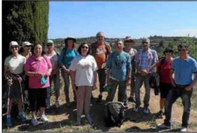
■ Une photo souvenir en surplomb du lac de Cambelliès.

C'est un joli programme qu'avait concocté Jacky pour la balade pédestre proposée par l'office de tourisme du nord du bassin de Thau, jeudi dernier. Ils étaient onze à lui emboîter le pas et s'élancer d'abord dans le vieux village, à la découverte des particularités des maisons vigneronnes, des portes de la cité, des éviars en saillie et autres curiosités, puis dans les chemins, en direction du lac de Cambelliès, sur les hauts de Loupian.