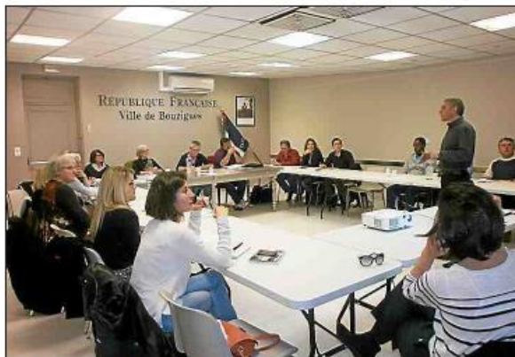
■ Des réunions se succèdent pour trouver le bon créneau.