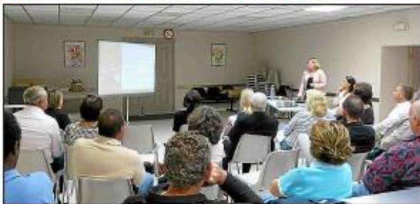
■ L'office de tourisme a récemment tenu une réunion en mairie pour présenter ce plan.

Parmi les objectifs : une meilleure visibilité de la commune et du Bassin sur internet.