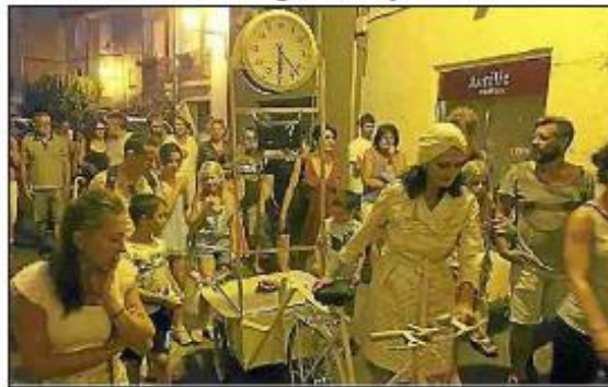
■ Une visite touristique d'un genre particulier.

La CCNBT et son office de tourisme ont comme chaque année programmé des soirées théâtrales pour faire découvrir les villages du nord bassin de Thau. Pour la saison 2016, l'OT a choisi la compagnie Surprise pour assurer ces balades, tous les mardis et mercredis de juillet et d'août.