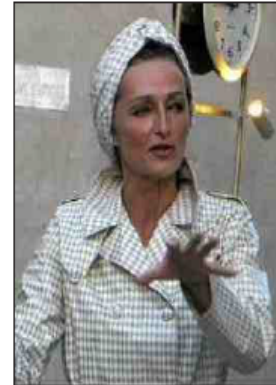
■ Fortunée est de retour à Poussan.

Corres. ML : 06 10 71 09 32 + midilibre.fr