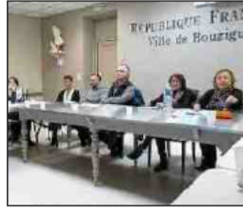
■ Une vingtaine de pros réunis.

Enfin, en 2016, le web passe au centre des préoccupations et devient un outil incontournable. L'OT progresse d'ailleurs